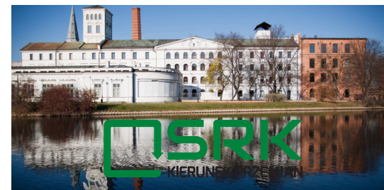
Prezentowanie na małokontrastowym tle